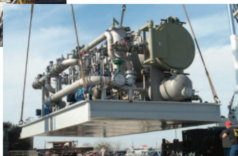
Sistema de filtros Ultipleat® de alto flujo