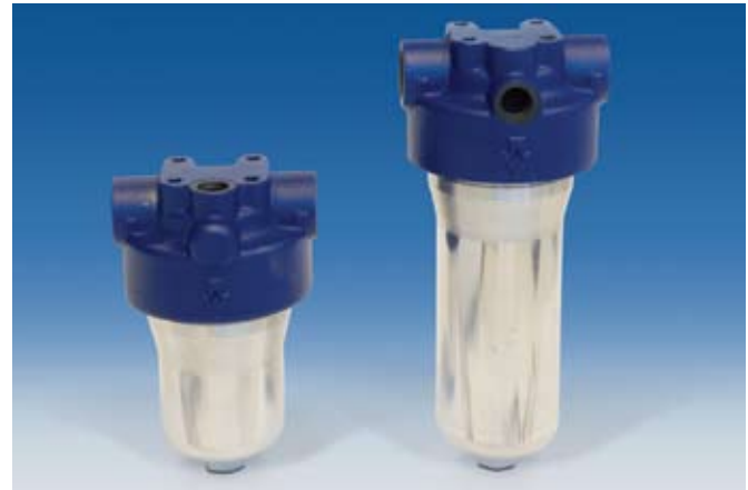
Carcasas de filtración de la serie F310