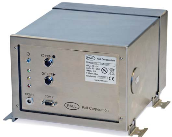
Pall Serie PCM200 Monitor per il controllo della pulizia dei fluidi