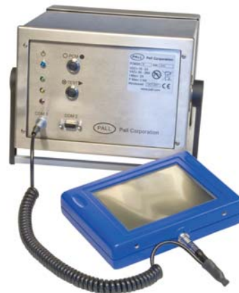
Unità palmare (opzionale)

I dati possono essere visualizzati su un PC o un PLC remoto mediante semplici comandi ASCII.