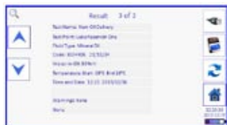
Mehrere Testdaten können für die nachfolgende Analyse und zum Download gespeichert und angezeigt werden.