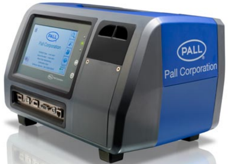
Monitor de análisis de limpieza de fluidos PCM500

*Código en 3 partes medido a 4 µm, 6 µm y 14 µm (c) según la norma ISO 16889.