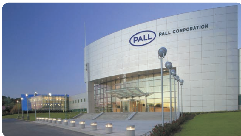
ポール本社(米国ニューヨーク州ポートワシントン)

社 名 Pall Corporation 本社所在地 米国、ニューヨーク州 ポートワシントン市