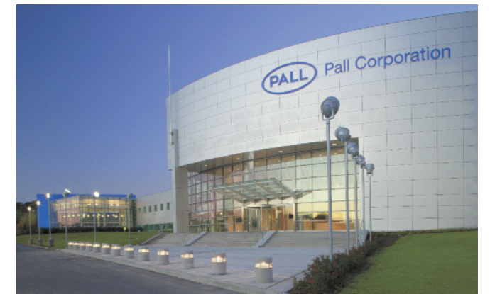
ポール本社(米国ニューヨーク州ポートワシントン)