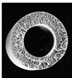
表1: 微生物除去性能