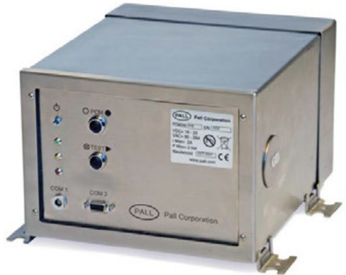
Serie Pall PCM200 Monitor de la Limpieza de los Fluidos