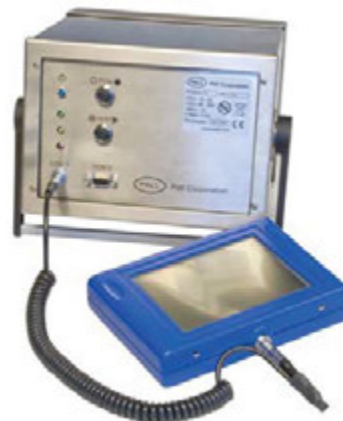
Pantalla de mano (opcional)

Dicha pantalla proporciona información y resultados de análisis en tiempo real que se almacenan automáticamente para la realización de actividades posteriores de determinación y evaluación de tendencias. Tales datos se pueden representar también en un PC o controlador PLC remoto empleando sencillos comandos ASCII.