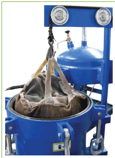
Resin bags XBG-PGG: easy to install and remove

Corps de filtre : Contient trois sacs de résine pour capter le vernis dans les systèmes d'huiles minérales ou synthétiques