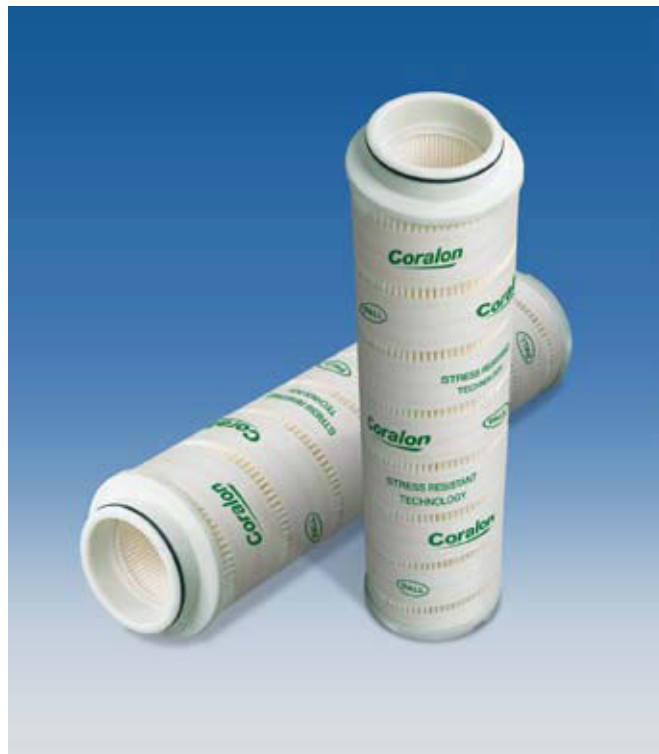
Фильтрующие элементы Coralon